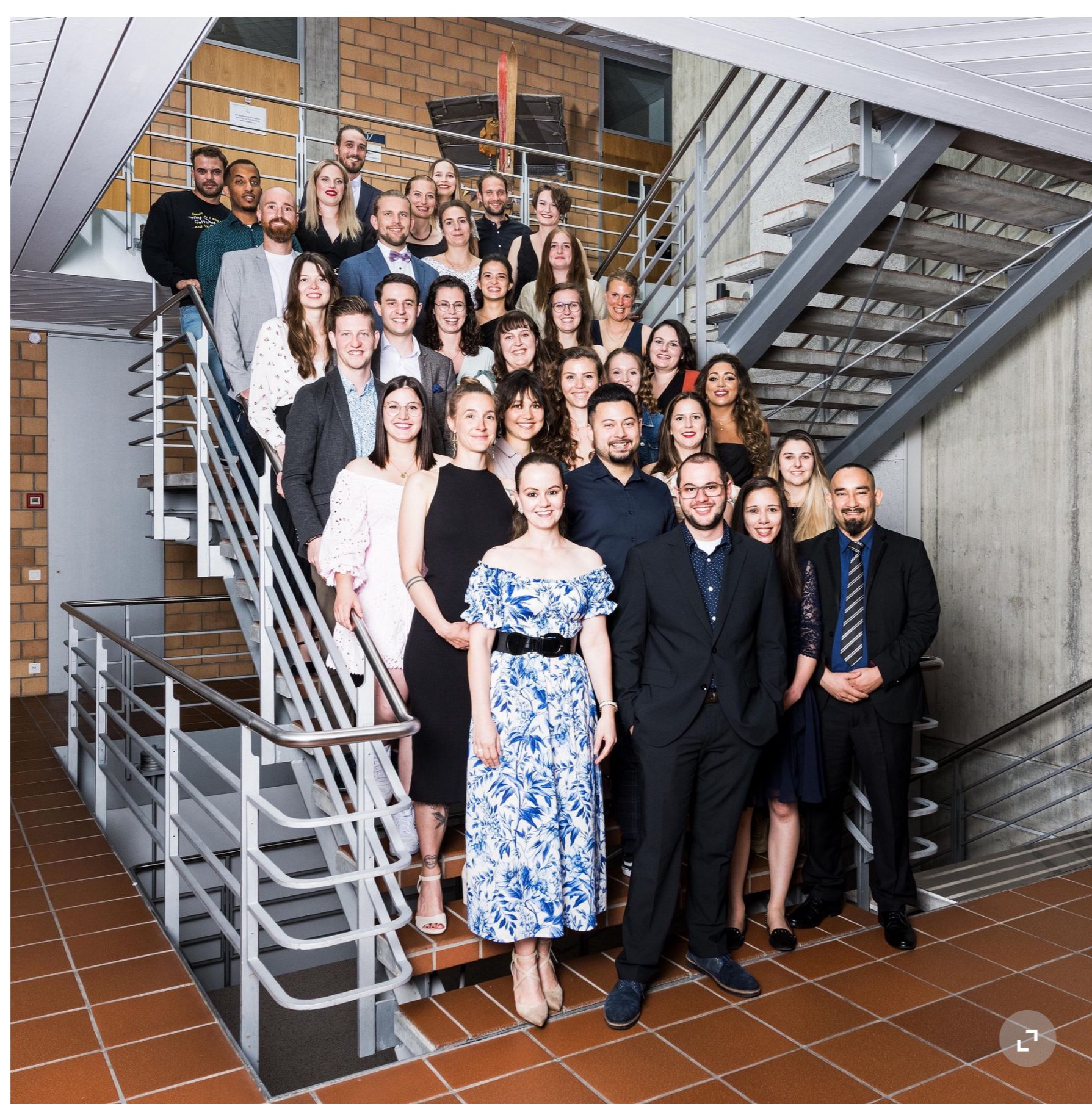
Die 39 Diplomandinnen und Diplomanden der Hotelfachschule Thun, die im Juni ihre Diplome entgegennehmen durften.